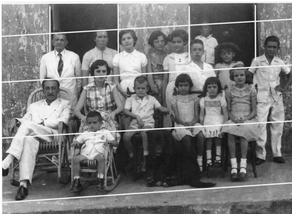
Abbildung 3: Planimetrie

Die Rekonstruktion der planimetrischen Ganzheitsstruktur von Familienfotos „bezieht sich auf die formale Konstruktion des Bildes in der Fläche. Da das Bild selbst eine Fläche ist, ist es die planimetrische Position, welche das Bild in der ihm eigentümlichen Gesetzlichkeit bestimmt“ (Bohnsack 2011, S. 39). Wie von Bohnsack (u.a. 2011, 2010) sowie von Wopfner (2012, S. 8) ausdrücklich erwähnt, ist diese Etappe von besonderer Bedeutung, da sie uns den Zugang zum „sehenden Sehen“ (Imdahl 1980, S. 92) oder den Weg von der Bildsyntax zur Bildsemantik (Mollenhauer 1996) eröffnet. Wichtig an dieser Stelle ist die Identifikation der planimetrischen Linien, die das Familienfoto als Ganzes organisieren und gleichzeitig „einen Zugang zur simultanen Organisation von Bedeutung in der Fläche und damit zur Eigenlogik des Bildes“ (Przyborski/Slunecko 2012, S. 27) erschaffen.