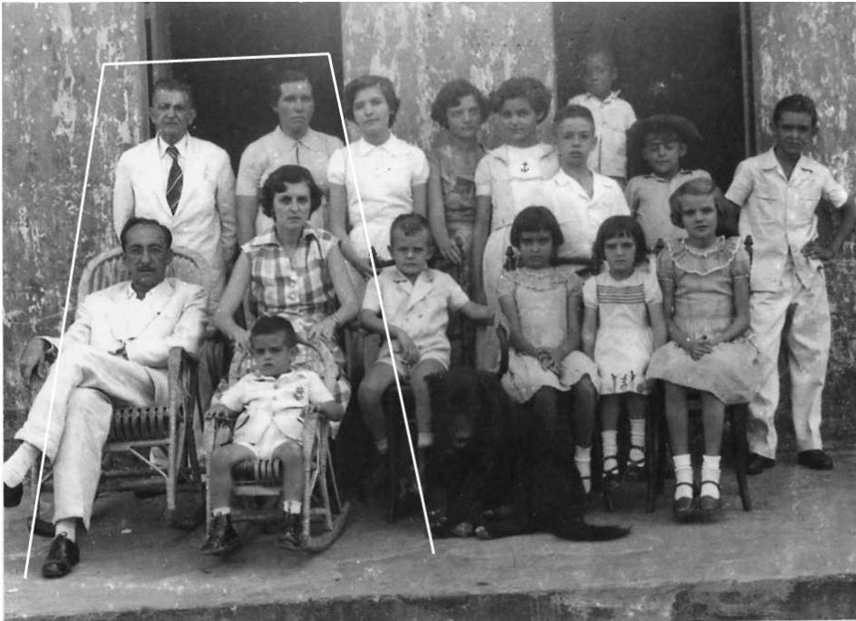
Abbildung 5: Szenische Choreografie

Außerhalb der Umrisslinie dieses Ensembles kann man genau in der Mitte des Bildes und vor der Reihe der anderen jüngeren Kinder einen großen und gut gepflegten Hund entdecken. Er wird als Familientier gezeigt, besonders der Kinder. Hinter dem Hund sind zehn Personen in zwei Reihen angeordnet sowie ein kleiner Junge im Hintergrund. Ein Junge sitzt auf einem Stuhl mit Armlehnen, der genauso groß ist wie der Stuhl der Frau neben ihm auf der linken Seite. Zwei der drei sitzenden Mädchen sind auf Stühlen und das mittlere Mädchen, die kleinste unter ihnen, sitzt auf einer Bank. Zwei Jungen aus der zweiten Reihen fallen praktisch aus der Bildkomposition heraus bzw. passen nicht zur Formalität der Gruppe. Der Junge ganz rechts lehnt sich an die Wand an und hat eine Hand hinter dem Rücken. Der andere Junge, der einen Hut trägt, hat die Arme auf dem Fenster, was seinen Bauch nach vorne projiziert. Diese beiden Jungen scheinen das Bild bzw. die Fotoaufnahme als einen Spaß zu betrachten und zeigen nicht die Ernsthaftigkeit und Strenge, die die anderen zeigen. Weiterhin sieht man im Hintergrund, dass der Junge außerhalb der Reihen die einzige Person auf dem Foto ist, die für die Abbildung des Bildes nicht besonders gekleidet war.