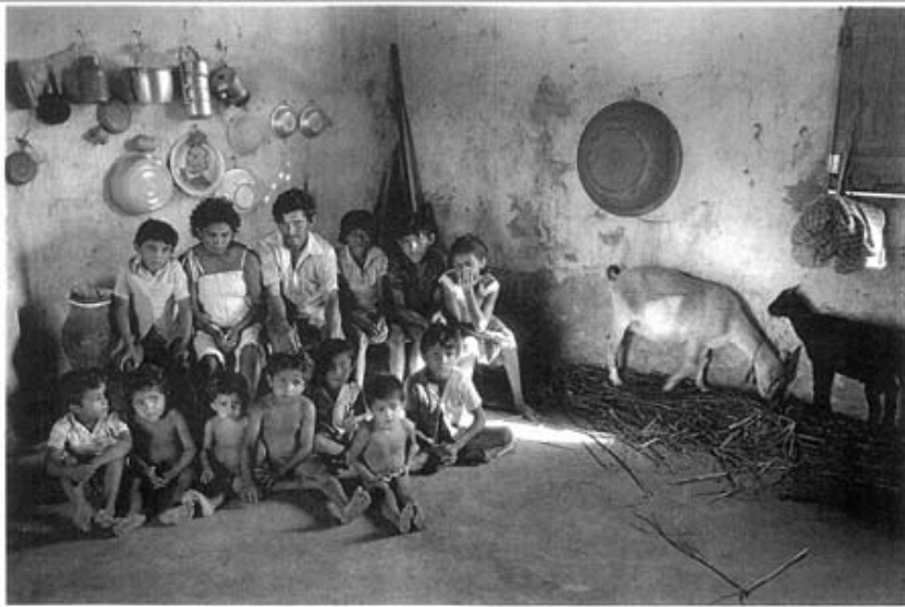
Abbildung 1: Sebastião Salgado, 1997 – Nachgedruckt in: Bohnsack 2010, S. 274.

Obgleich sowohl der Fotograf als auch die abgebildete Familie aus Brasilien stammen, haben sie dennoch unterschiedliche Lebenserfahrungen, die in der Darstellung „zum Vorschein kommen“. Sebastião Salgado ist ein Vertreter des engagierten Fotojournalismus und verankert die Produktion seiner Bilder in der marxistischen Matrix. Laut Mauad (2008) versucht er mit seinen Bildern auf die Lebensumstände der abgebildeten Bildproduzenten aufmerksam zu machen, um diese Verhältnisse zu kritisieren und anzuprangern.